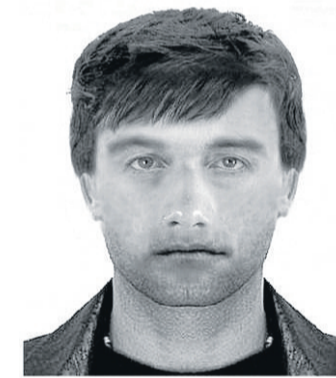
Dieser Mann soll die Frau vergewaltigt haben.

Der Mann wird wie folgt beschrieben: Er ist circa 30 Jahre alt und 1,85 Meter groß. Er hat eine normale Statur, braune, etwas längere,