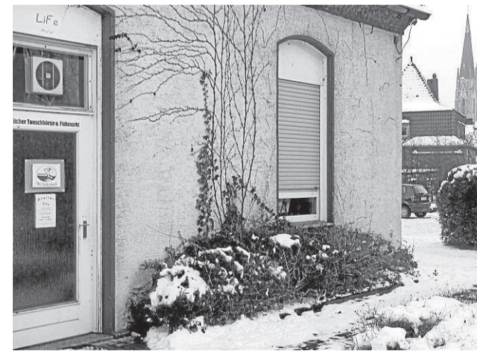
Zurzeit nutzt die DLRG Billerbeck Räume in der ehemaligen Arztpraxis am St. Ludgerus-Stift, möchte aber so bald wie möglich ein neues Domizil im Freibad verwirklichen.

Die DLRG bleibt aber nicht nur in Sachen Vereinsheim am Ball, auch was Training und Aus-/Weiterbildung angeht, schieben die Aktiven in der Winterzeit keine ruhige Kugel. Jeden Dienstag steht Schwimm- und Techniktraining im Coesfelder Hallenbad auf dem Programm, und jeden Mittwoch ist Ausdauertraining und Breitensport in den Turnhallen angesagt. Samstags besteht von 11 bis 11.45 Uhr die Möglichkeit zur Wassergymnastik, berichtet Hanni