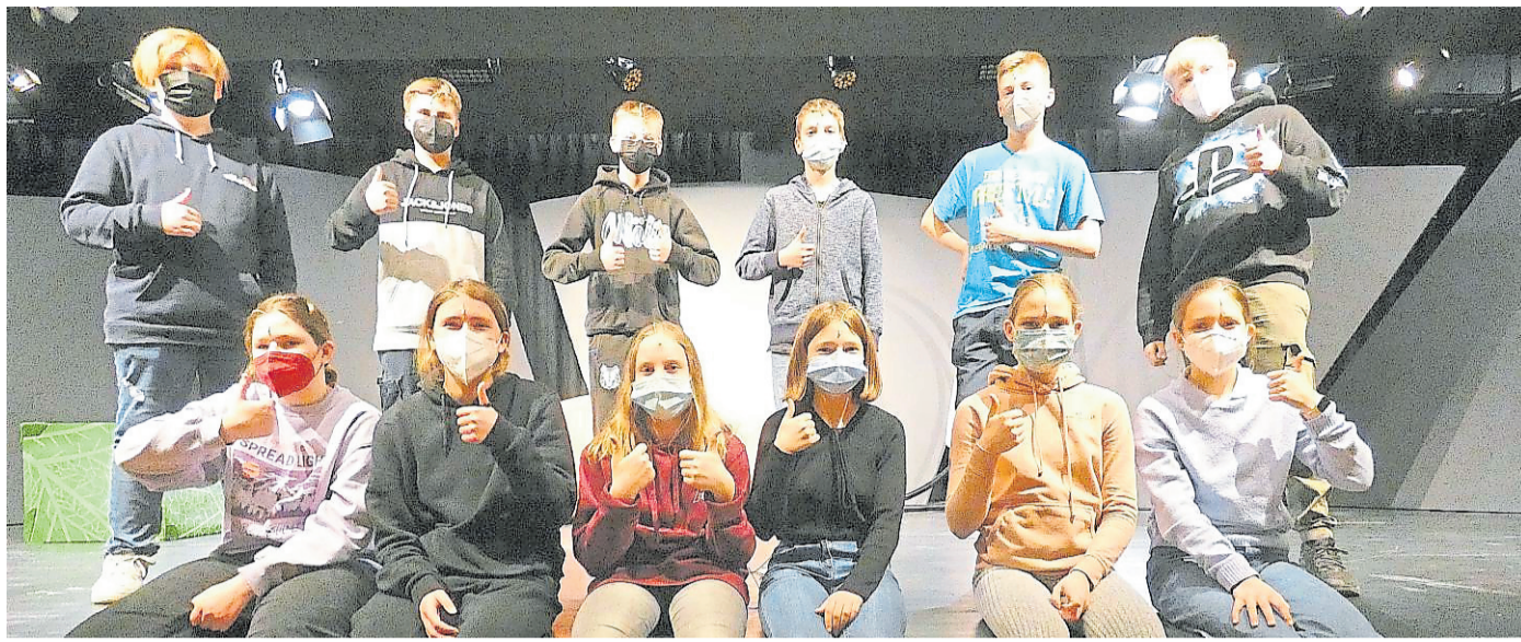
Daumen nach oben: Die Proben laufen gut und die Konfirmanden freuen sich auf ihren Auftritt im Gottesdienst an Heiligabend. Wer mit ihnen feiern möchte, muss sich anmelden und 2G+-Regel beachten.